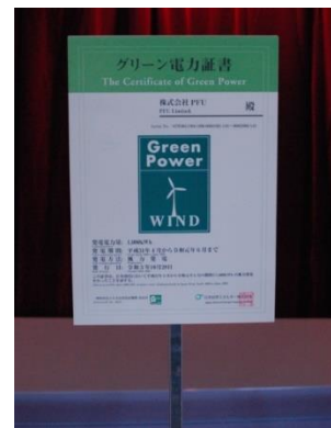
グリーン電力の掲示 (PFU クリスマスチャリティコンサート)

「PFU クリスマスチャリティコンサート」(12月11日:金沢開催)において、会場で使用した機器の使用電力をすべて風力発電によるグリーン電力でまかない、国内の自然エネルギー普及や地球温暖化の抑制に貢献しました。