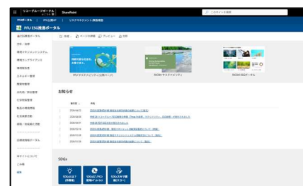
社内向け ESG 推進ポータルサイト