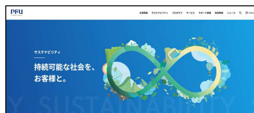
サステナビリティホームページ

PFU 公開サイトの中に「サステナビリティ」ページを設けて「サステナブル経営」、「E 環境」、「S 社会」、「G ガバナンス」に関する考え方や取り組み、これからの方向性を掲載して「社会課題の解決」や「持続可能な社会形成」に貢献できる企業を目指した活動を展開しています。 社内向け情報発信の環境も整えて、PFU グループで働く方の SDGs 意識の高揚を図っています。