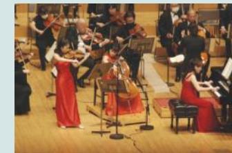
PFUクリスマス・チャリティコンサート