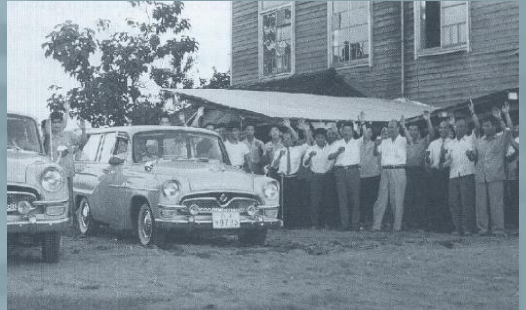
1962年7月 製品第一号の出荷

私たちは「創業時のベンチャースピリット」を忘れず、 既存の枠にとらわれない新たなチャレンジを 続けます。