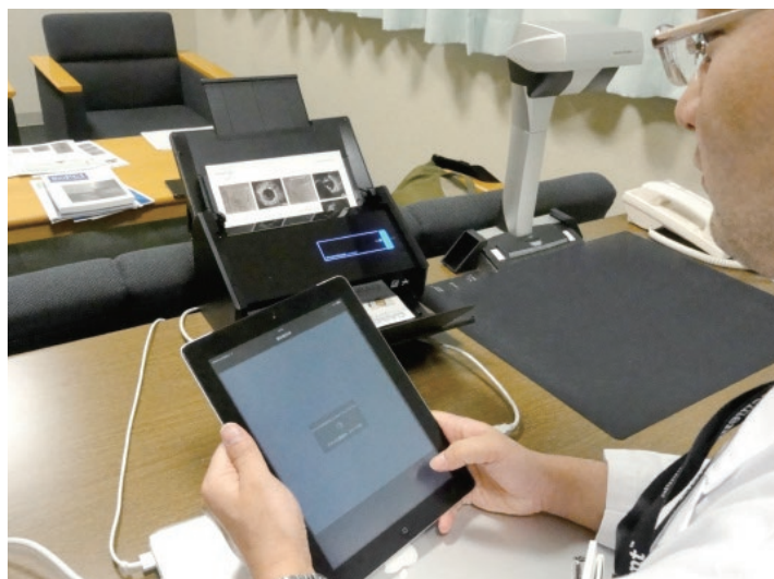
『iX500』で読み取り、Wi-Fi で iPad へ転送。

このような仕事上の効率化に加え、「PDFとiPadのRetinaディスプレイとの親和性が非常によく、目が疲れにくい。拡大すれば小さな文字も読みやすくなる。それもPDFを多用する理由の1つです」と日常使うツールだからこそ、大事にしたい視点を口にした。