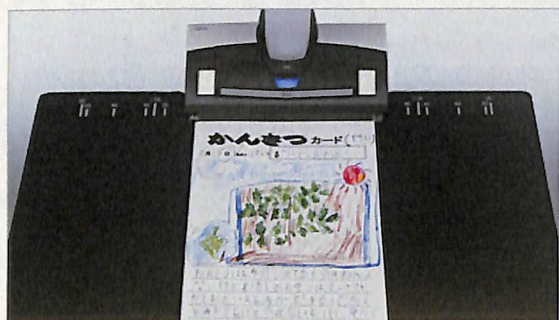
大切な書籍や書類も手軽にスキャン可能

ページの連続スキャンを効率化する「ページめくり検出」スキャン時にページをめくったことを自動検出し連続スキャンできる「ページめくり検出」機能を搭載。ワンアクションで一冊の本を手間なく電子化できます。イメージデータを簡単に電子書籍にできる「楽々(らくらく)ブッククリエイター」スキャンした原稿サイズに応じてデジタル書棚上での表示サイズを自動設定したり、表紙カバーを取り込み本の表紙・背表紙を使ったサムネイル画像の作成が行える「楽々(らくらく)ブッククリエイター」を「楽々ライブラリ Smart」に搭載。「SV600」のスキャン操作から続けて簡単に電子書籍化できます。