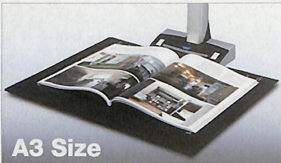
原稿の大きさを問わずスキャン可能