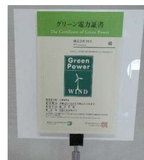
グリーン電力証書

「PFU クリスマスチャリティコンサート」(12 月 10 日:金沢開催)において、会場で使用した機器の使用電力をすべて風力発電によるグリーン電力でまかない、国内の自然エネルギー普及や地球温暖化の抑制に貢献しました。