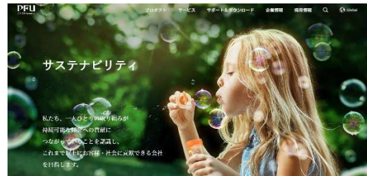
サステナビリティホームページ

PFU 公開サイトの中に「サステナビリティ」ページを設けて「サステナブル経営」、「E 環境」、「S 社会」、「G ガバナンス」に関する考え方や取り組み、これからの方向性を掲載して「社会課題の解決」や「持続可能な社会形成」に貢献できる企業を目指した活動を展開しています。社内向け情報発信の環境も整えて、PFU グループで働く方の SDGs 意識の高揚を図っています。