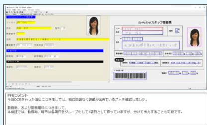
OCR評価結果資料 (PFU技術者によるコメント記載)